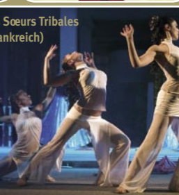
Les Soeurs Tribales (Frankreich)