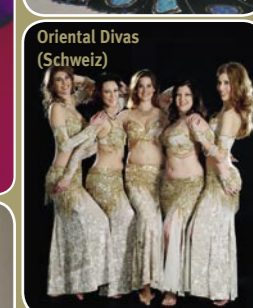
Oriental Divas (Schweiz)