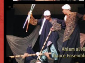
Ahlam al Nil Dance Ensemble