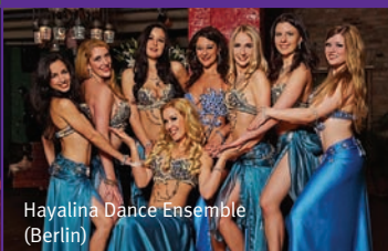
Hayalina Dance Ensemble (Berlin)