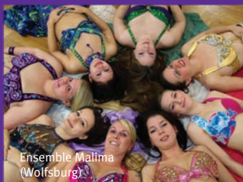
Ensemble Malima (Wolfsburg)