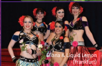
Elifana & Liquid Lemon (Frankfurt)